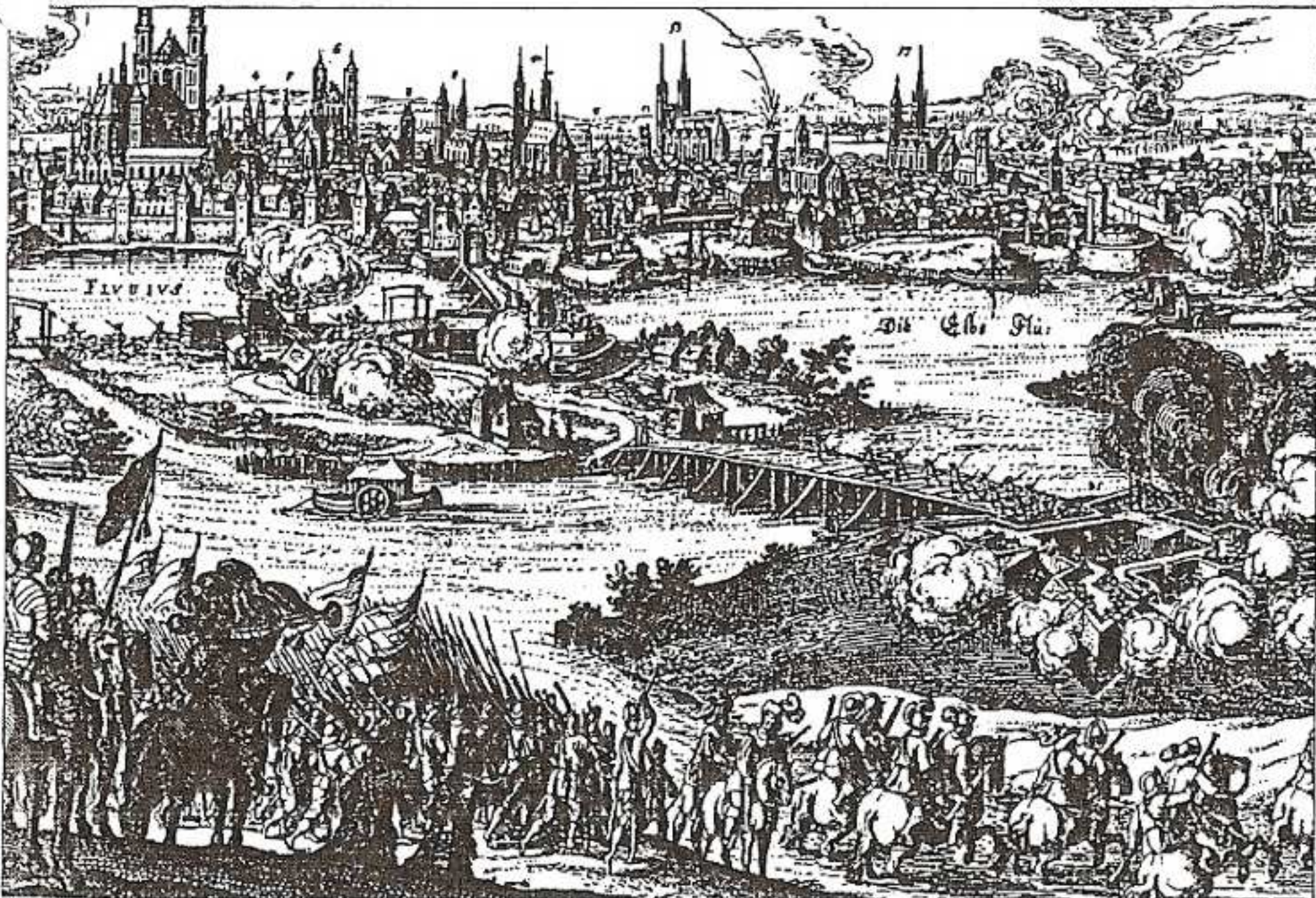
Magdeburgs Eroberung durch Tilly und Pappenheim im Mai 1631. nach einem Kupferstich von Matthäus